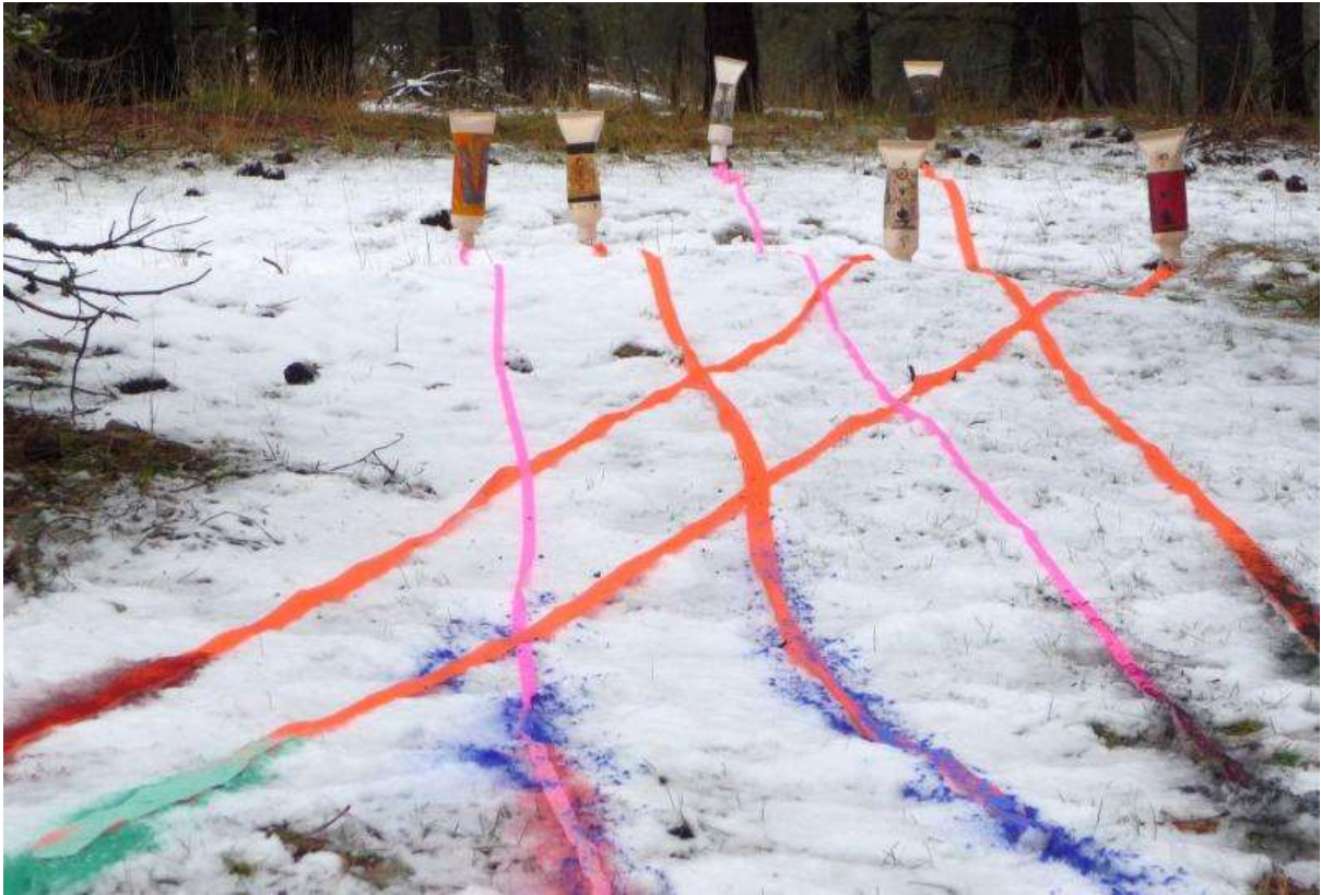
หลอดสี หิมะ ทะเลทราย โดย กมล ทัศนัญชลี ศิลปินแห่งชาติ (ทัศนศิลป์) ศิลปินสองซีกโลก

1. สร้างจินตนาการ (IMAGINATION) หรือการสร้างภาพขึ้นในใจ เพื่อเป็นแนวทางกำหนดรูปแบบงานที่จะสร้างสรรค์ ควรถ่ายทอดลักษณะรูปแบบใด เช่น รูปแบบเหมือนจริง รูปแบบตัดทอน รูปแบบตามความรู้สึก และจะมีเนื้อหาอย่างไร เช่น เป็นเนื้อหาเรื่องราวจากประสบการณ์ตรง ประสบการณ์ทางอ้อม หรือคิดสร้างสรรค์ใหม่ เป็นต้น