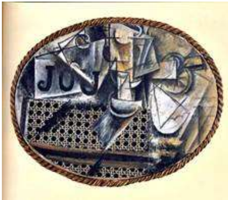
STILL LIFE WITH CHAIR CANNING, 1912

ของศิลปะแบบภาพปะติด (COLLAGE) ผสมผสานกับการวาดในภาพ เพื่อให้เกิดมิติทางอารมณ์สัมผัส และยังเป็น การแสวงหากลวิธีในการแสดงออกทางความงามในรูปแบบใหม่ๆ ผลงานที่มีชื่อเสียงตามกลวิธีนี้ เช่น STILL LIFE WITH CHAIR CANNING นอกจากนี้ยังได้พัฒนาการสร้างผลงานโดยใช้วัสดุสำเร็จรูปที่มี ลักษณะ 3 มิติ ปะติดลงในผลงาน เช่น GUITAR AND BASS BOTTLE เป็นต้น ต่อมาศิลปะแบบ ภาพปะติด ได้ถูกนำมาดัดแปลงใช้ในองค์ประกอบที่หลากหลาย จนประยุกต์สู่ยุคปัจจุบันที่รู้จักกันในนาม สื่อผสม (MIXED MEDIA) ซึ่งหมายถึงการนำเอาวัสดุ และกลวิธีต่างๆ ในการสร้างงานทัศนศิลป์มา ผสมผสานกันด้วยการจัดองค์ประกอบทางศิลปะให้เกิดเป็นรูปแบบความงามใหม่อย่างอิสระ