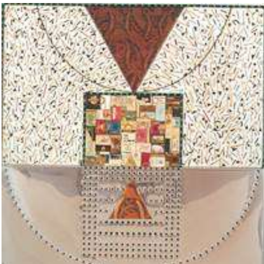
ผลงานของ อาจารย์เตชา วราชน ศิลปินแห่งชาติ (ทัศนศิลป์)

3. หลักการด้านการนำไปใช้ การออกแบบและการสร้างงานต้องให้เกิดคุณค่าในการนำไปใช้ตรงตามวัตถุประสงค์ในการสร้าง